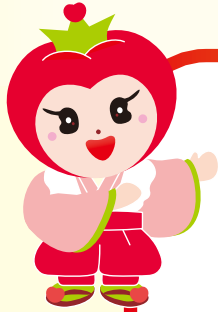
JA小松市 イメージキャラクター 「こまとちゃん」

JA小松市総合ポイントサービスの名称で、各事業の利用に応じてポイントが貯まります。貯まったポイントを使って、お買い物券やオリジナル商品と交換したり、品物の購入に利用できるとてもお得なサービスです。